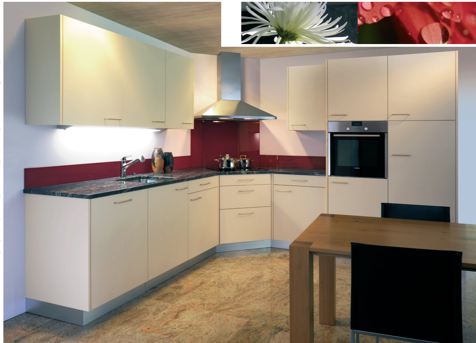
Fronten: Kronoswiss Magnolia | Griffe: Edelstahl gebürstet | Abdeckung: Granit California Blue